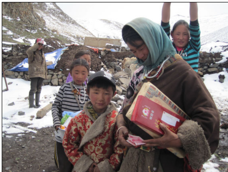
Nomader på sommerbeite i Seku. Det er nå stor gjensynsglede når BUV-gjengen dukker opp.

Brikkene i vår lille BUV-organisasjon faller altså på plass en etter en, så vår utfordring er ikke lenger kapasitet og kompetanse, men penger, og her må jeg bare innrømme at vi har en lang vei å gå om vi skal klare å samle inn de 14 millioner kroner det vil koste å drive BUV med et snitt på 720 barn de neste 5 årene.